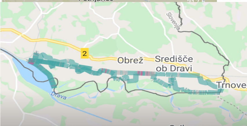
Slika 2: Krog 35 km