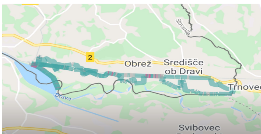
Slika 2: Krog 35 km